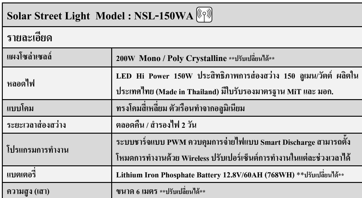
แบบเสากลม